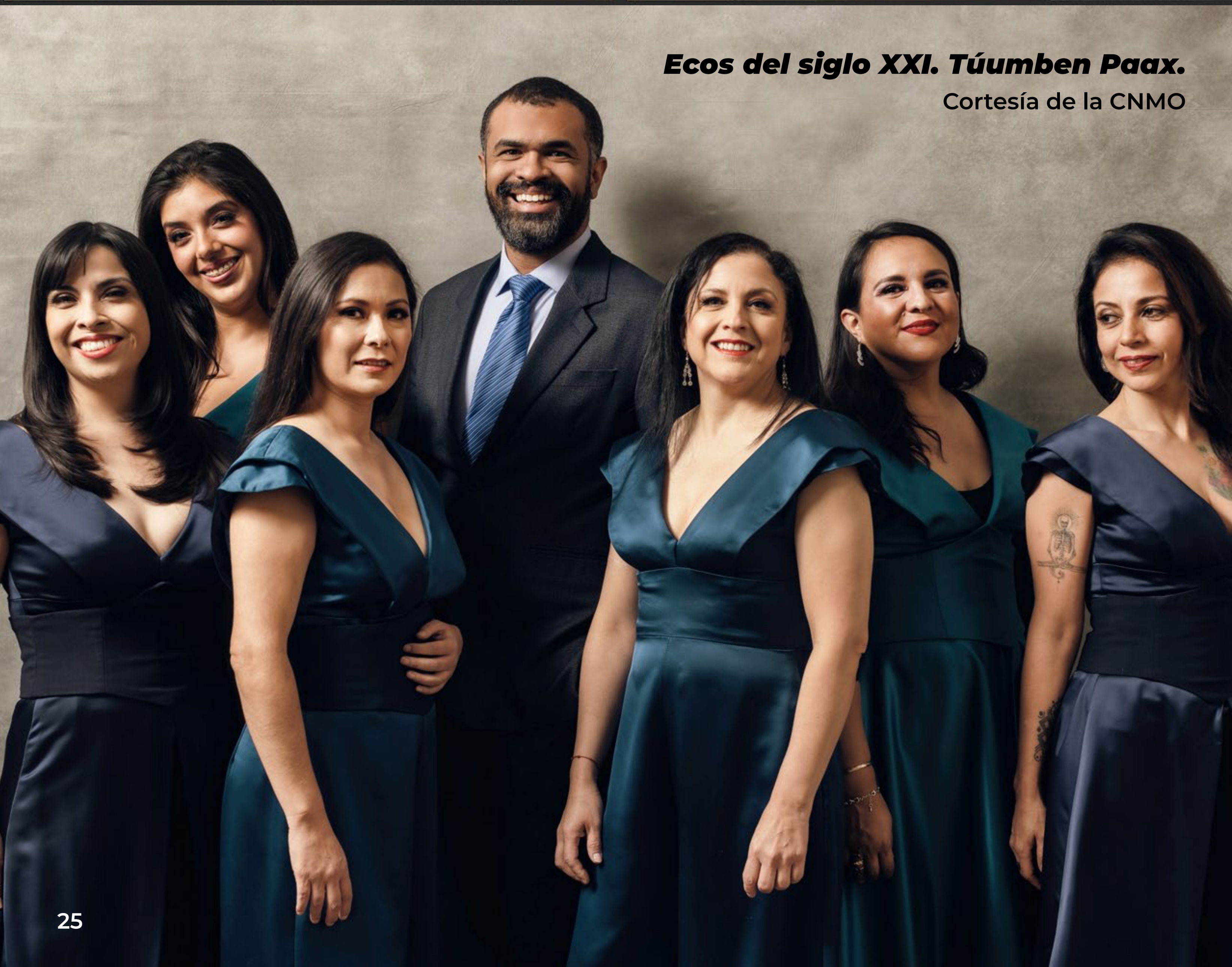
Ecos del siglo XXI. Túumben Paax.